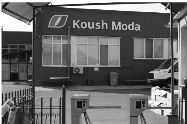
Fabrika "Koush moda"

U Bugarskoj niko od ispitanika ne zarađuje zakonsku minimalnu zaradu za standardno nedeljno radno vreme, dok nijednom radniku nije na odgovarajući način isplaćen prekovremeni rad.